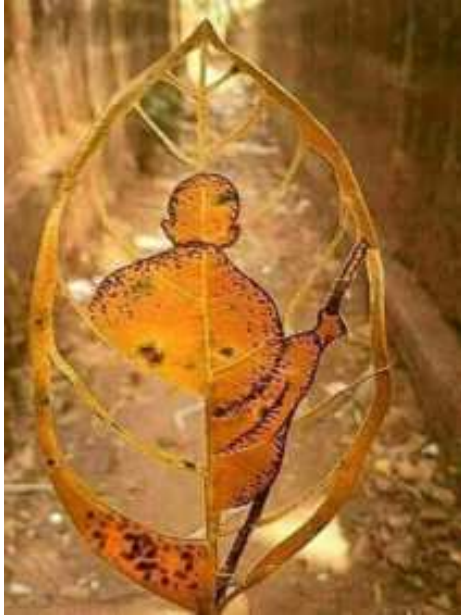
പ്ലാസിലയിൽ കോറിയ കരവിരുത്

ഒരിക്കൽ ഒരാൾ ദൈവത്തോടു ചോദിച്ചു. എല്ലാ പെൺകുട്ടികളും മനോഹരമായി പുഞ്ചിരിക്കുന്നു. പക്ഷെ, ഭാര്യമാരെല്ലാം എപ്പോഴും ദേഷ്യത്തോടെ പെരുമാറുന്നു. ദൈവം മറുപടി പറഞ്ഞു. പെൺകുട്ടികളെ ഭൂമിയിലേക്കയച്ചത് ഞാനാണ്... അവരെ ഭാര്യമാരാക്കിയത് നിങ്ങളും. കൃഷ്ണം നിങ്ങളുടേതുതന്നെ.