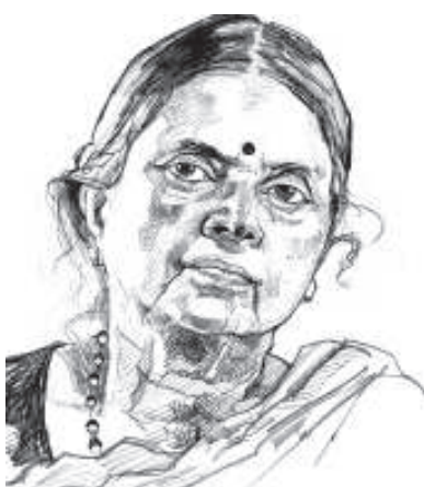
'അഭയയുടെ പ്രാർത്ഥനാ മുറിയിൽ നിന്നും വൈബിളിംഗ് ഖുർ ആനും മാറ്റുമെങ്കിൽ ആവശ്യമായ പണമത്രയും നൽകാമെന്ന വാഗ്ദാനം നിരസിച്ചു. 'അഭയ ഒരു ഹിന്ദു സംഘടനയല്ല. നാമെന്തിനു സഹായിക്കണം' എന്നു പറഞ്ഞ ക്രിസ്ത്യൻ പാതിരിമാരെയും അവഗണിച്ചു. 'ഒരു സത്യക്രിസ്ത്യാനിയുടെയും ഒരു ശുദ്ധ ഹിന്ദുവിന്റെയും പണം അഭയയ്ക്ക് ആവശ്യമില്ല' എന്നു പറഞ്ഞുകൊണ്ടാണ് ഫൊക്കാന കൺവൻഷനിൽ പങ്കെടുത്തതിനുശേഷം അമേരിക്കയിൽ നിന്നും മടങ്ങിയത്.