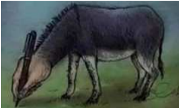
A masterpiece painting by an egyptian painter,describing the "Media"

നവമാധ്യമങ്ങൾ നമ്മുടെ ജീവിതരതിന്റെ ഭാഗമാക്കിയിട്ടുണ്ട്. പ്രാചീനം അതിനൊരു മാതൃകയാണ് വെളിച്ചം താഴെ കാണുന്ന ചിത്രം. ഹോസ് ബുക്ക്, വാട്ട്സാപ്പ് തുടങ്ങിയ മാധ്യമങ്ങളിലൂടെ കടന്നു പോകുമ്പോൾ ചില ആശയങ്ങളിലോ ചിത്രങ്ങളിലോ നമ്മുടെ ശ്രദ്ധ പതിക്കാറുണ്ട്. എന്നാൽ അത് ആരാണ് പോസ്റ്റ് ചെയ്തതെന്നോ, എവിടെ ചെയ്തതെന്നോ നാം ശ്രദ്ധിക്കാറില്ല. അതേരീതിയിലുള്ള പോസ്റ്റുകൾക്ക് ഉടമസ്ഥതയും അവകാശപ്പെടാൻ കഴിയാറില്ല. അതേസമയം പ്രചരിക്കുന്നു, അതിൽ ചിലത് ഇവിടെ പുനഃപ്രസിദ്ധീകരിക്കുകയാണ്. ചിരിക്കാനും ചിന്തിക്കാനും ചിലത് നമ്മെ പ്രേരിപ്പിക്കുന്നു. ചിലത് വൈജ്ഞാനികമാകുന്നു.