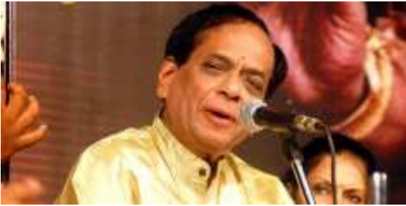
“എന്തരോ മഹാനുഭാവമല്ല അന്തരീകി വന്ദനമു ചന്തുരു വർണ്ണനിയന്താ... ചന്തമുനു ഹൃദയാരവിന്ദമനുജുജി ബ്രഹ്മാനന്ദ മനുഭവിഞ്ചുവ

(ഈ ലേഖനത്തിൽ) എത്ര മഹായാതുണ്ടോ അവർക്കെല്ലാവർക്കും (എന്റെ) നമസ്കാരം